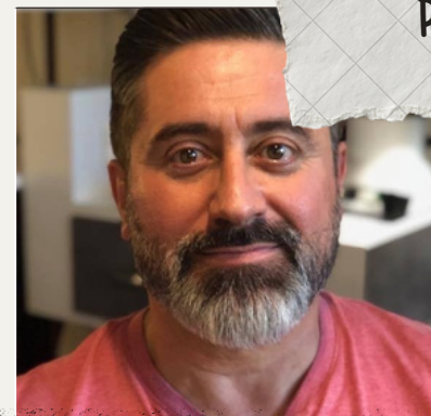
MISE EN SCÈNE